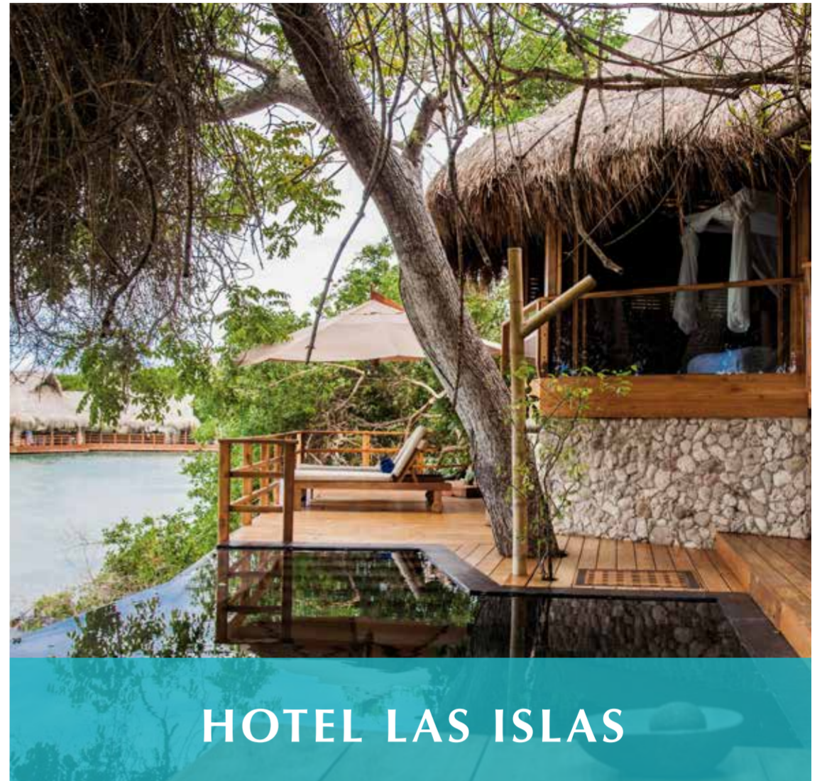
HOTEL LAS ISLAS